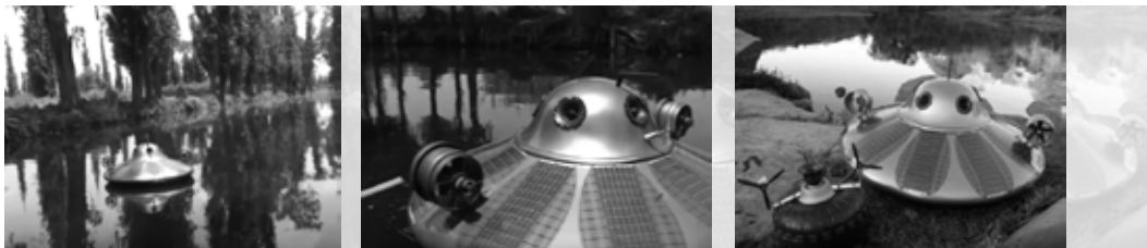
Figuras 3 a 5

Arcángelo Constantini; su arte y la tecnología